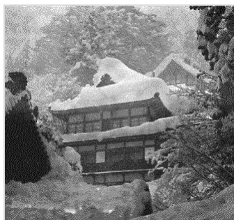
▲雪害 永平寺 昭和38年 61284