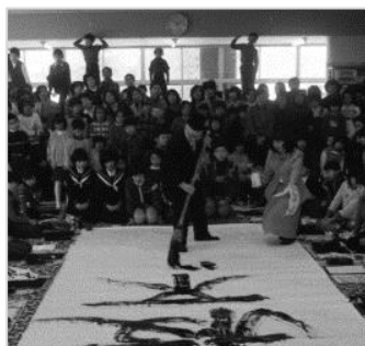
▲書き初め 昭和56年 68074

文書館の研修室（定員40名）を会議や打ち合わせなどに利用できます。詳細は県立図書館まで。（TEL (0776) 33-8860）